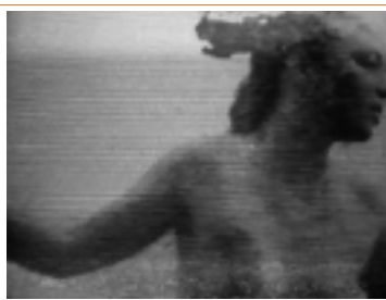
mona hatoum: changing parts

La colección pluridisciplinaria e internacional del Museo Nacional de Arte Moderno-Centro de Creación Industrial del Centro Pompidou, comprende 50 000 obras (pintura, escultura, arte gráfico, fotos, arquitectura, diseño, cine), incluyendo una colección significativa de obras en video, escogidas y presentadas por primera vez en el Perú, durante el 6 Festival Internacional de video/arte/electrónica.