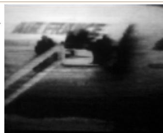
johan grimompmez: dial H-I-S-T-O-R-Y