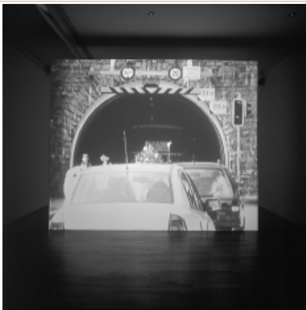
marcel odenbach: el instinto del rebaño

Sucesos como ceremonias fúnebres, partidos de fútbol, conciertos de música pop, manifestaciones callejeras y por supuesto también el carnaval de la ciudad de Colonia, en Alemania, despiertan en él el recuerdo de un sentimiento "arcaico" de excitación colectiva. Partiendo de la reflexión sobre estas manifestaciones por demás simbólicas, del éxtasis y de la histeria masivos, el autor dirige su mirada a lo que en su comportamiento ritual tienen de común las distintas culturas. No encuentra la práctica de lo mágico en África ni en Asia, sino en el instinto gregario de su entorno más cercano. Muestra así un rebaño de fanáticos aficionados al fútbol, añoranza de aquel espacio perdido en el cual una vez fue posible vivenciar impunemente y en toda su extensión las pasiones y los sentimientos. Lo mostrado es una dionisiaca marea de cuerpos humanos, gritería y virilidad, que se funde en un único, enorme, orgiástico organismo.